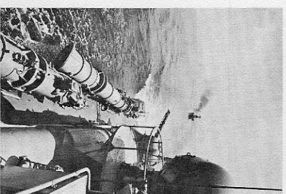
Titelbild Sowjetische Torpedoschnellboote der „Sherstun“-Klasse bei Luftabwehrübungen.